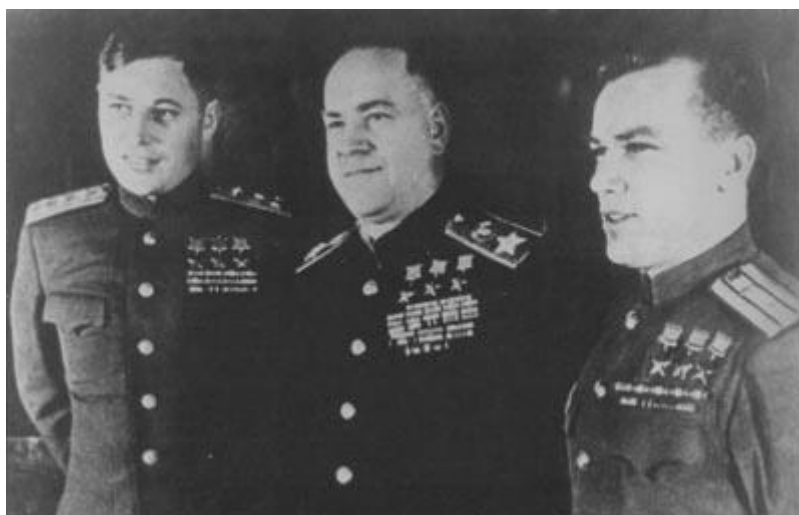
Трижды Герои Советского Союза (слева направо)

В годы Великой Отечественной войны лётчикам А. И. Покрышкину и И. Н. Кожедубу это звание было присвоено трижды. Маршал Советского Союза Г. К. Жуков удостоен высокого звания Героя Советского Союза четырежды (1939, 1944, 1945, 1956).