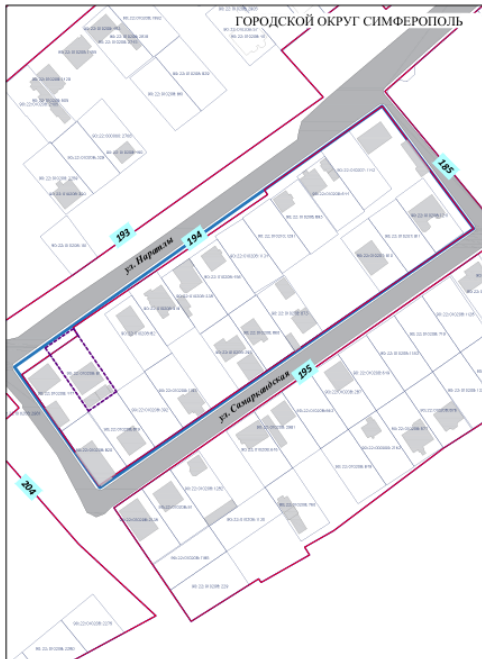
ЧЕРТЁЖ МЕЖЕВАНИЯ ТЕРРИТОРИИ 1:500