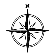
Схема инженерного обеспечения территории М 1:1000