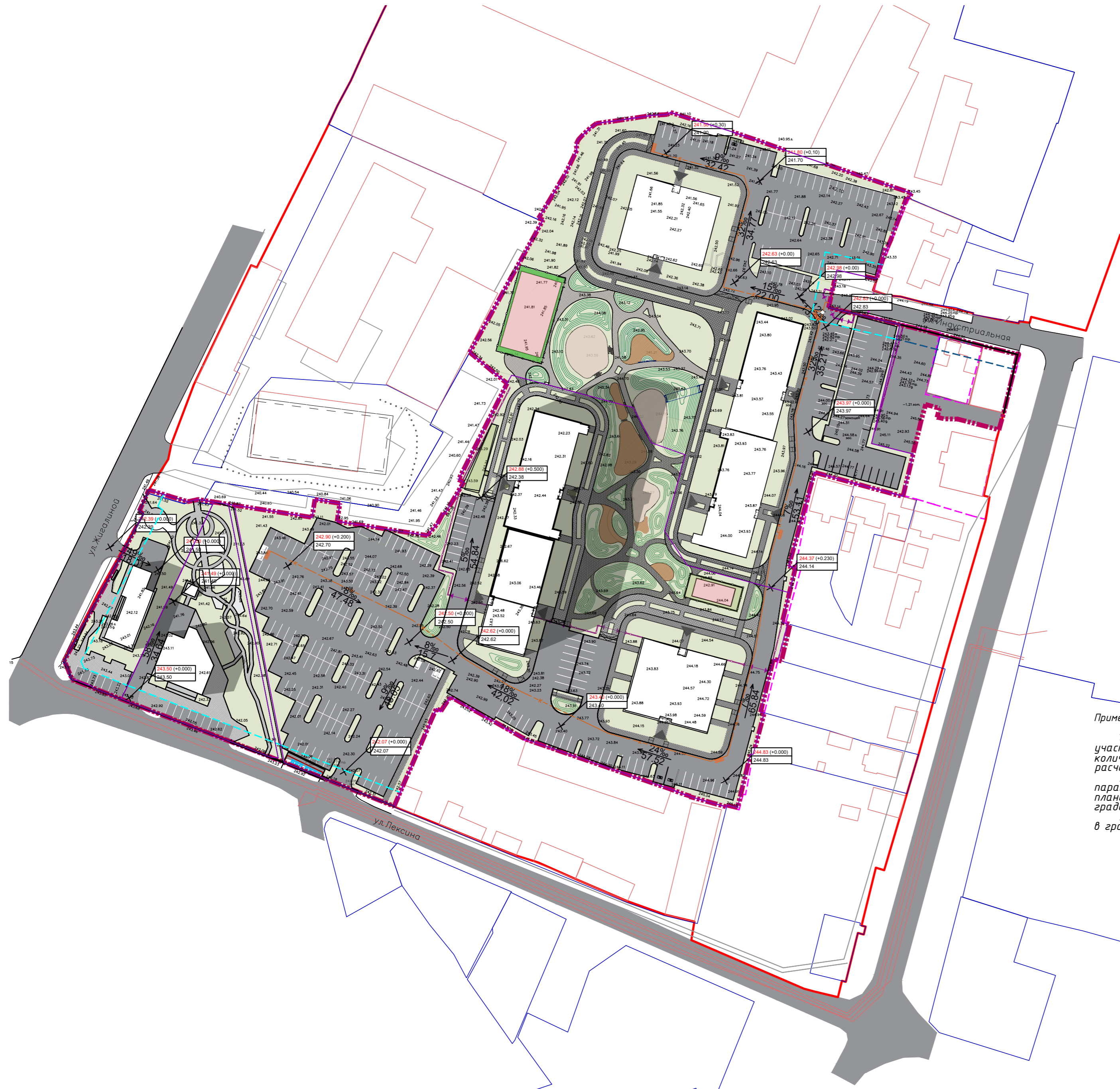
Схема вертикальной планировки и инженерной подготовки территории. М 1:1000