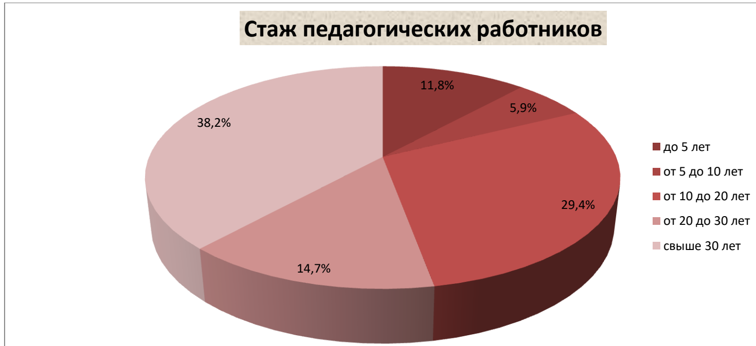
Характеристика педагогического коллектива по возрасту