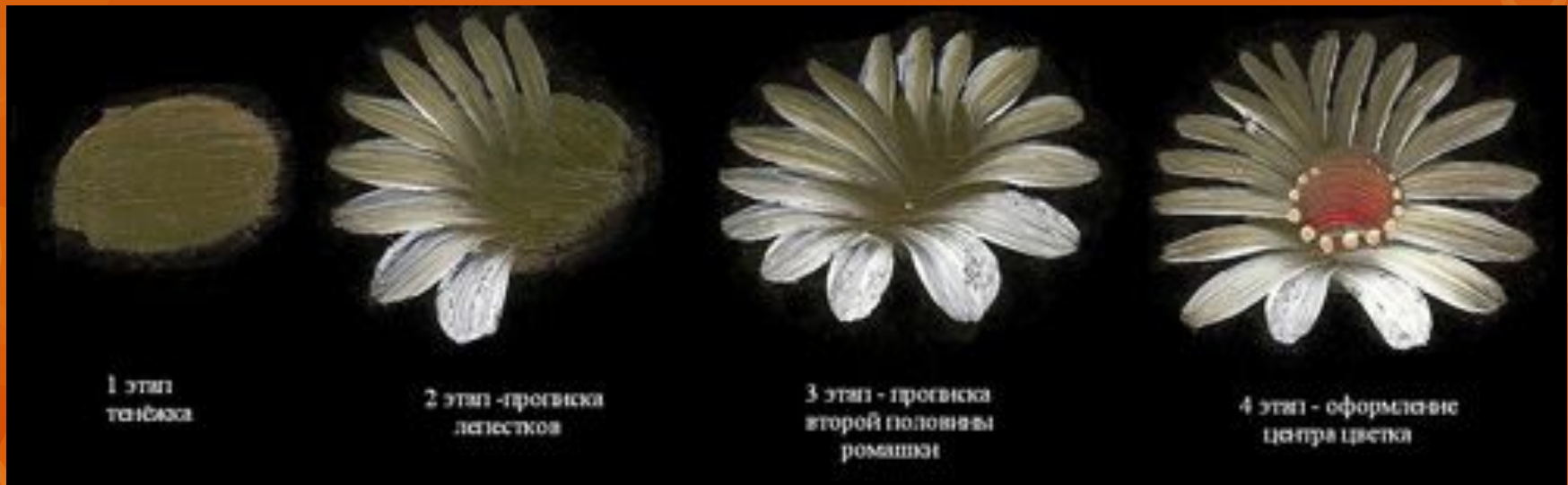
1 этап тонировка