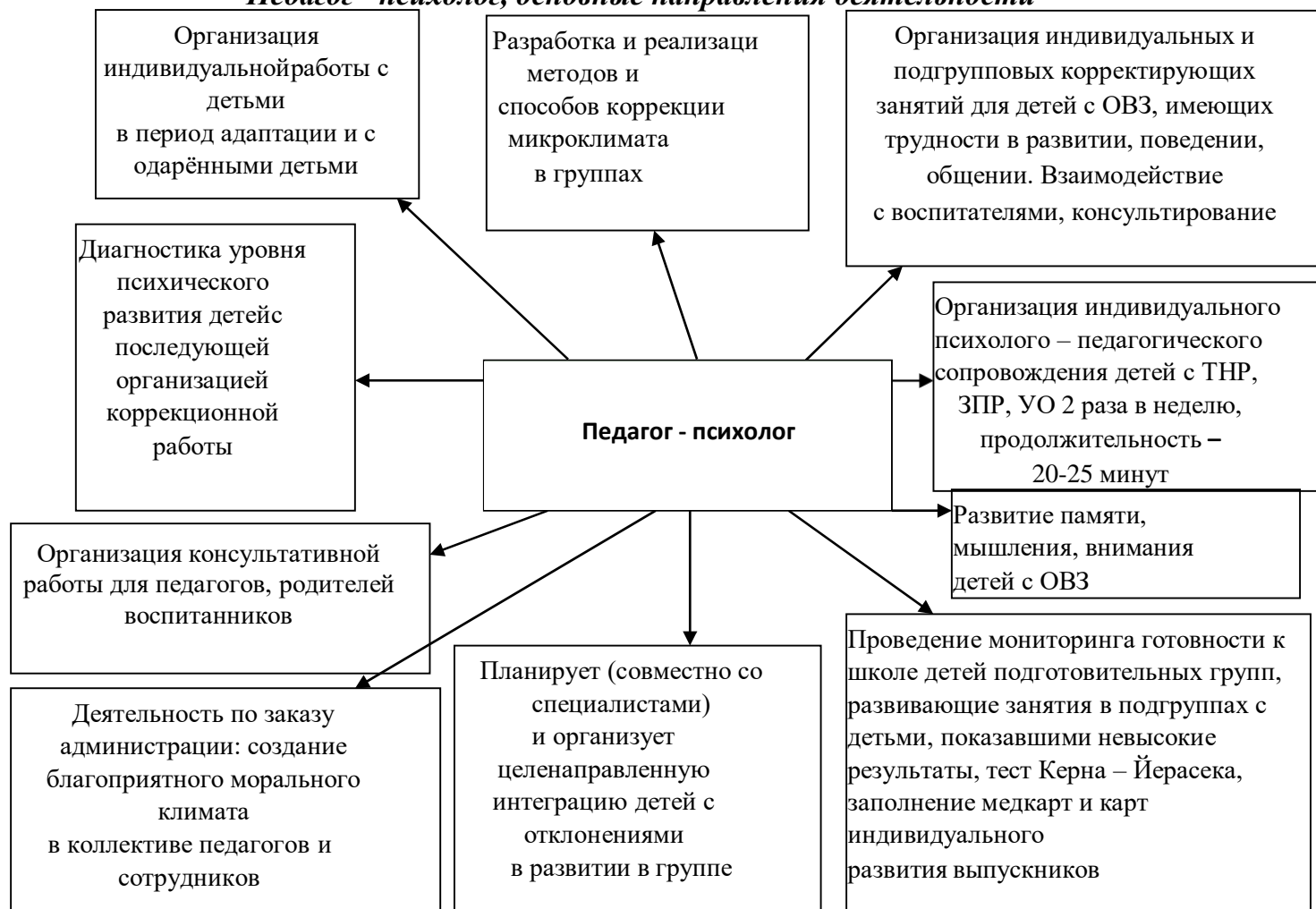
Рис. 2 «Педагог - психолог, основные направления деятельности»