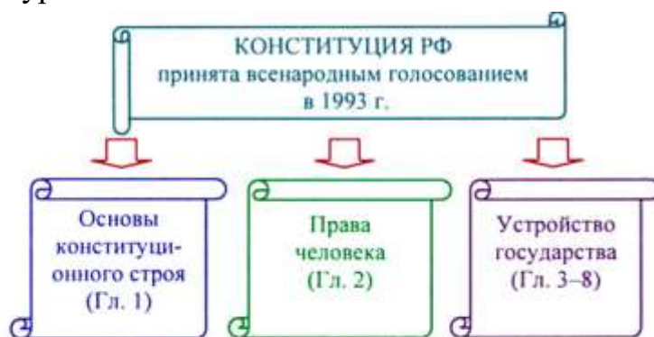
Закрепление прав человека в правовых документах