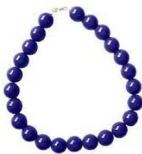
Картинка бусы синие