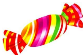
Картинка конфета сладкая