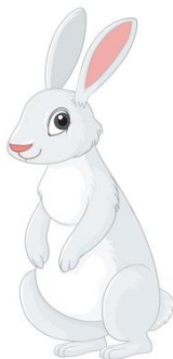
Картинка заяц белый