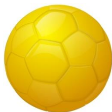
Картинка мяч желтый