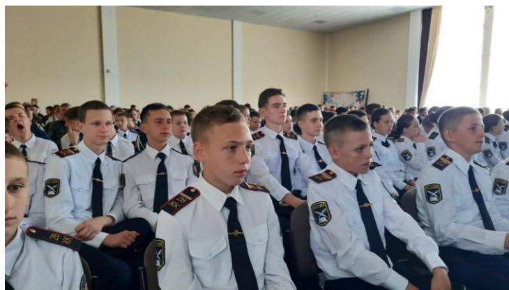
24.05.24 ПОСЛЕДНИЙ ЗВОНОК