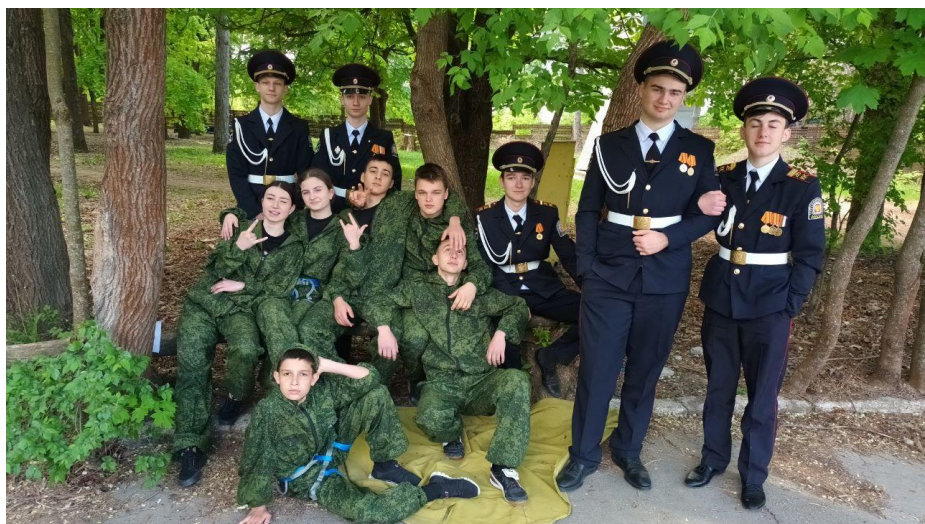
20.04.24г Участие и победа в Региональном этапе военно-спортивной игры «Растим патриотов»