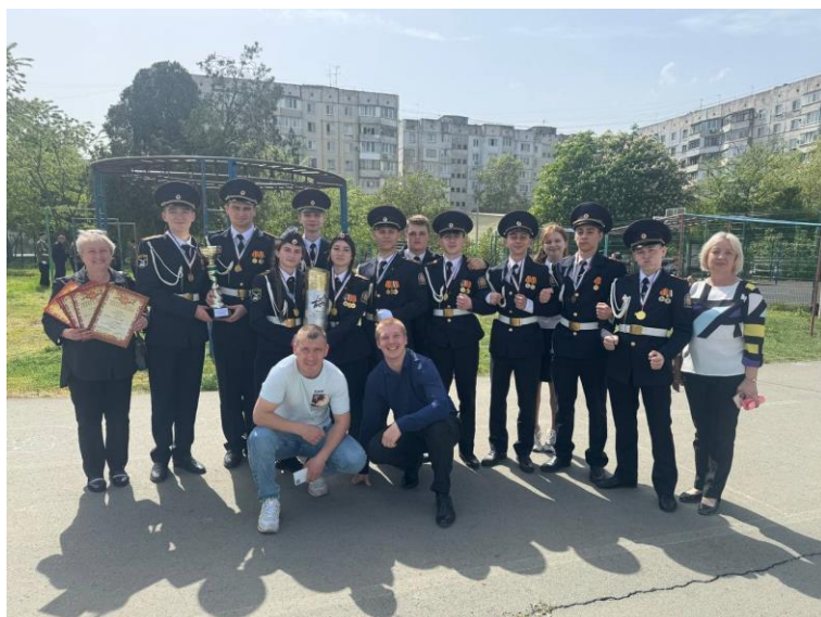
2 мая. Экскурсия в г. Феодосию.