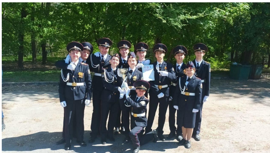
13 апреля. Воинское кладбище. День освобождения Симферополя.