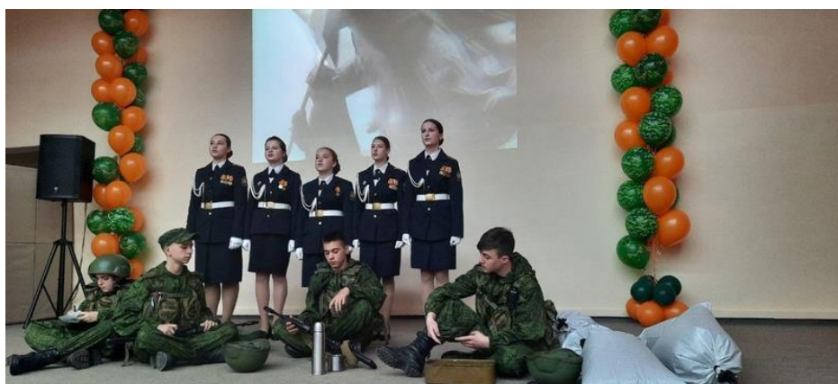
05.04.2024 Кадеты приняли участие в открытии музея славы на территории МВД России по республике Крым, а также стали их первыми посетителями.