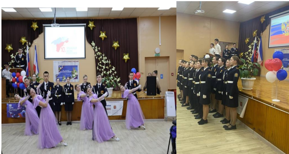
20 марта 10-К принял участие в муниципальном конкурсе «МЫ НАСЛЕДНИКИ ПОБЕДЫ»