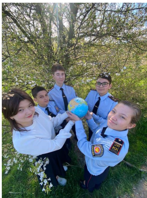
13.04 2024 В Симферополе прошёл финальный этап турнира «ПАМЯТИ ГЕРОЕВ ОТЕЧЕСТВА»