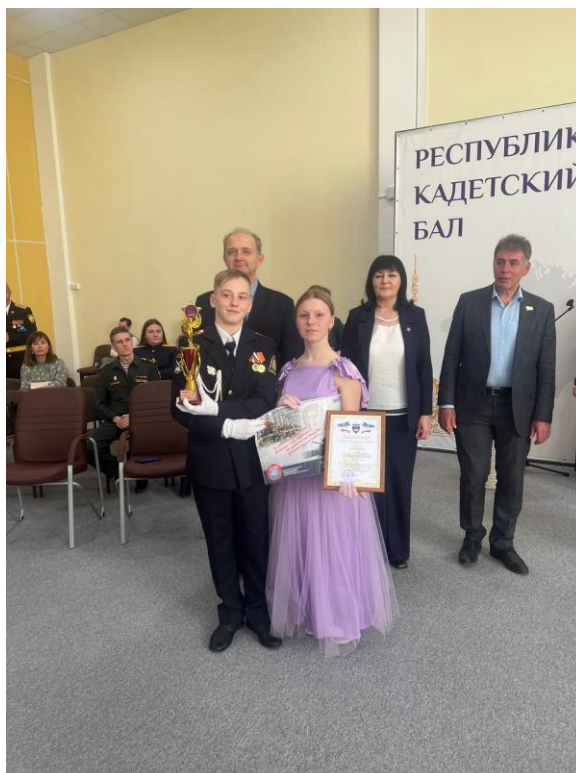
7 марта. Участие в школьном концерте. Поздравление девочек 7-К с Международным женским днем.