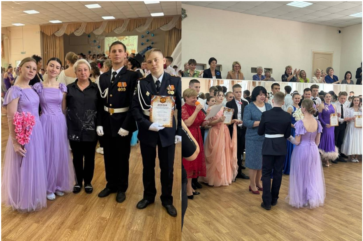
19 апреля Участие и победа в турнире памяти героев отечества.