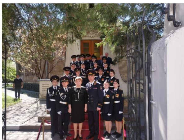
13.04.24 участие в праздновании 80-ЛЕТИЯ ОСВОБОЖДЕНИЯ СИМФЕРОПОЛЯ