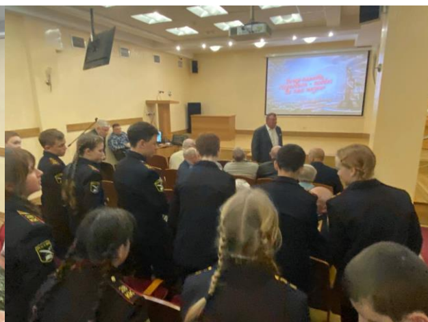
26.04 Участие и победа в ВОЕННО-СПОРТИВНОЙ ИГРЕ «ПОБЕДА -2024»