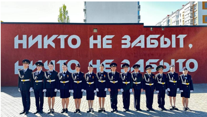
18.04 2024 Кадетский корпус школы № 28 принял активное участие в муниципальном фестивале "Крымский вальс».