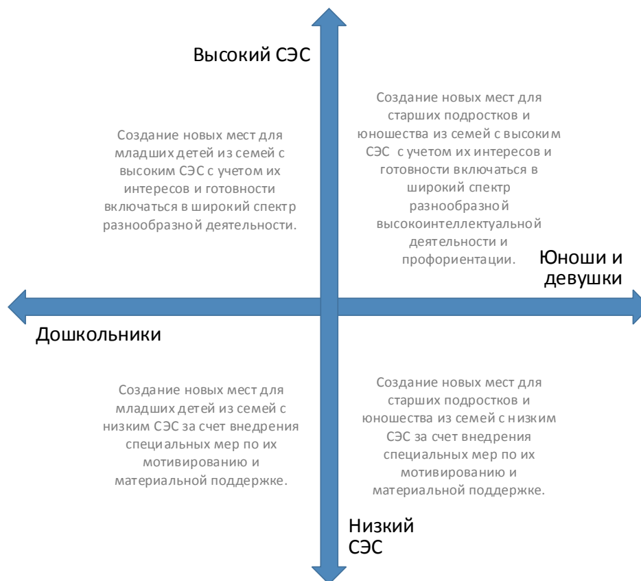
Рис. 5. Шкалы выбора модели создания новых мест по программам художественной направленности с учетом особенностей контингента обучающихся

Вовлечение в программы детей из семей с низким образовательным и культурным уровнем потребует осуществления определенных PR-шагов, поиска мотиваторов для данных детей, в том числе, материальных.