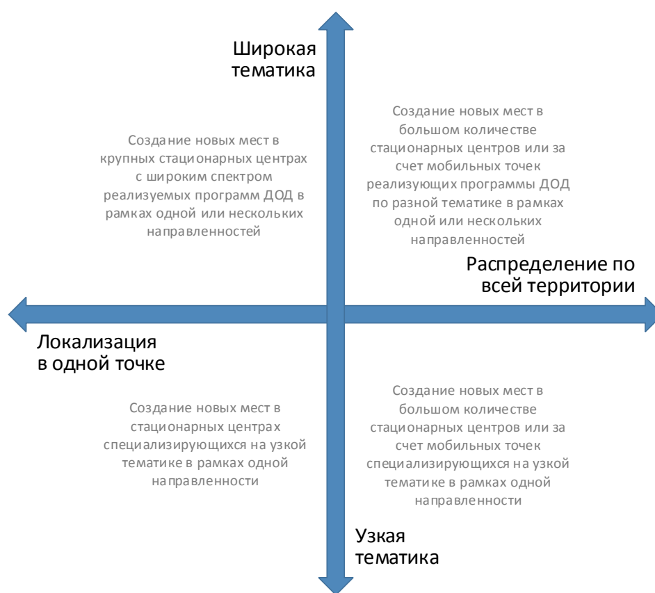
Рис. 3. Шкалы выбора масштаба и формы реализации новых мест по программам ДОД

При невыполнении хотя бы одного из них возникает необходимость пространственного распределения реализуемой модели через мобильные или сетевые решения.