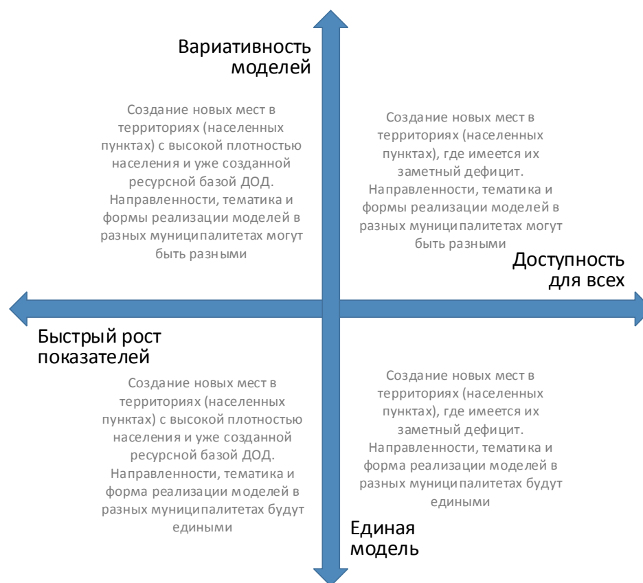
Рис. 4. Шкалы выбора модели создания новых мест с учетом актуальной управленческой политики