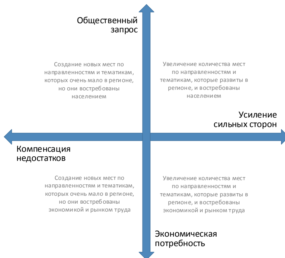
Рис. 2. Шкалы выбора тематики и тактики создания новых мест дополнительного образования