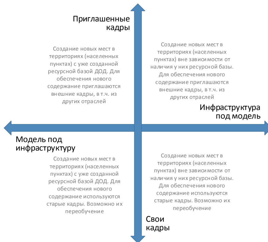
Рис. 6. Шкалы выбора модели инфраструктурного и кадрового обеспечения для типовой модели создания новых мест дополнительного образования

Следует отметить, что механизмы инфраструктурного и кадрового обеспечения не существуют в их полярных вариантах. Решения даже в рамках реализации одной модели будут различны. Анализ перечисленных выше характеристик позволяет сделать эти точечные решения более точными и эффективными.