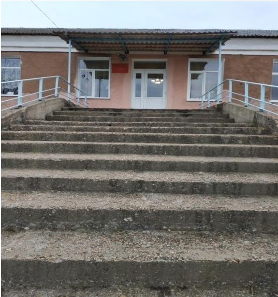
4. Главный вход в здание школы (подъем)