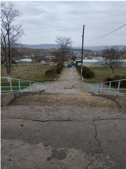
5. Главный вход в здание школы (спуск)