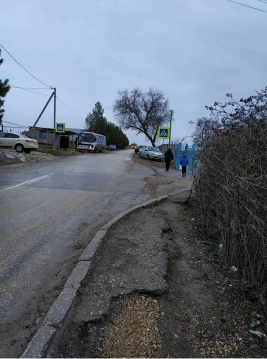
1. Дорога перед въездом на территорию школы