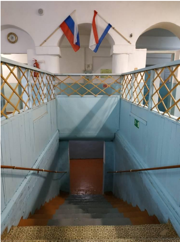
12. Лестница в столовую (цокольный этаж)