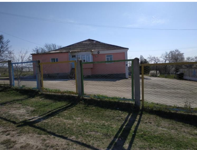
3. Место парковки машин