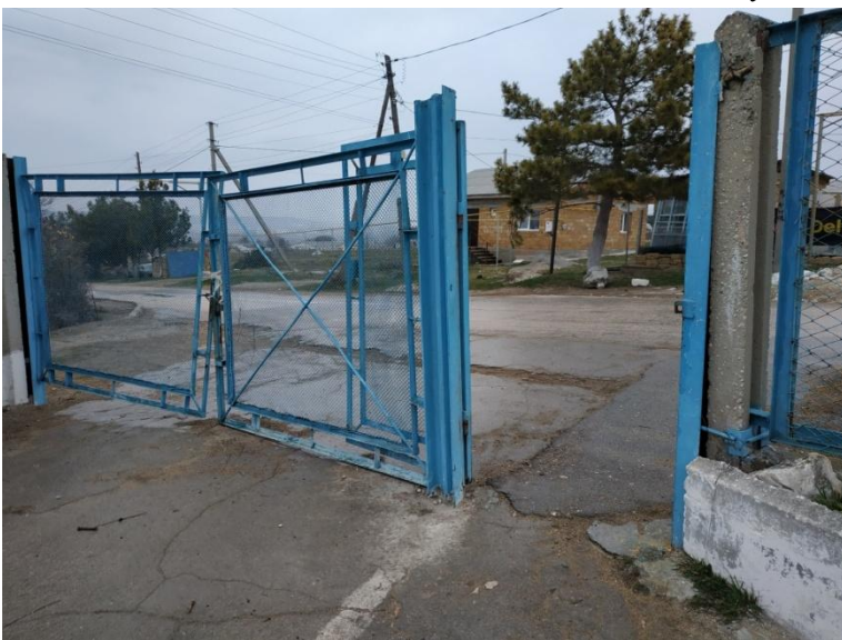
8. Ворота школы. Вход с ул. Комарова