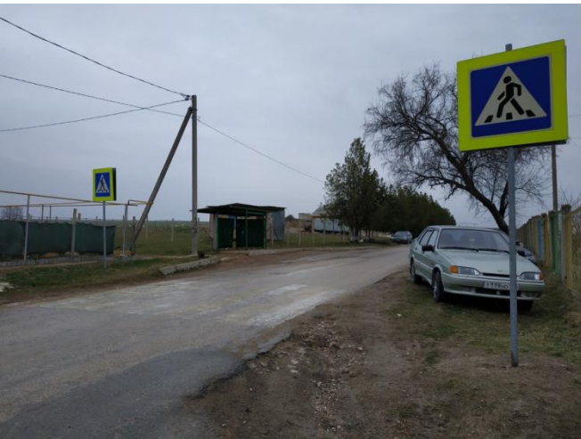
2. Пешеходный переход (ул. Комарова)