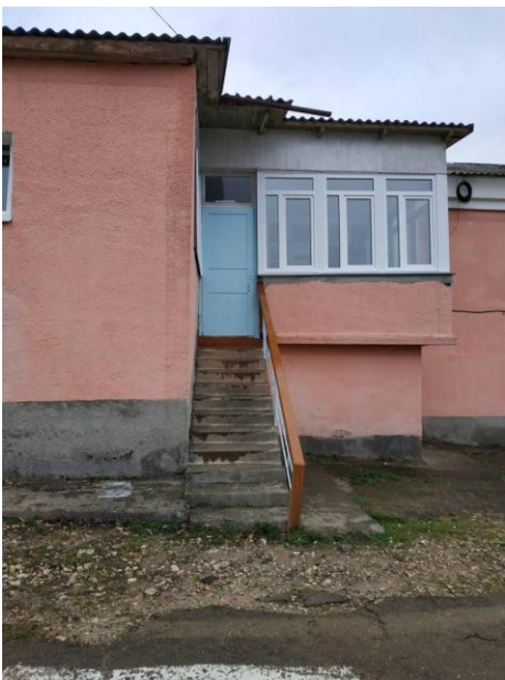
6. Запасной пожарный выход с ул. Комарова