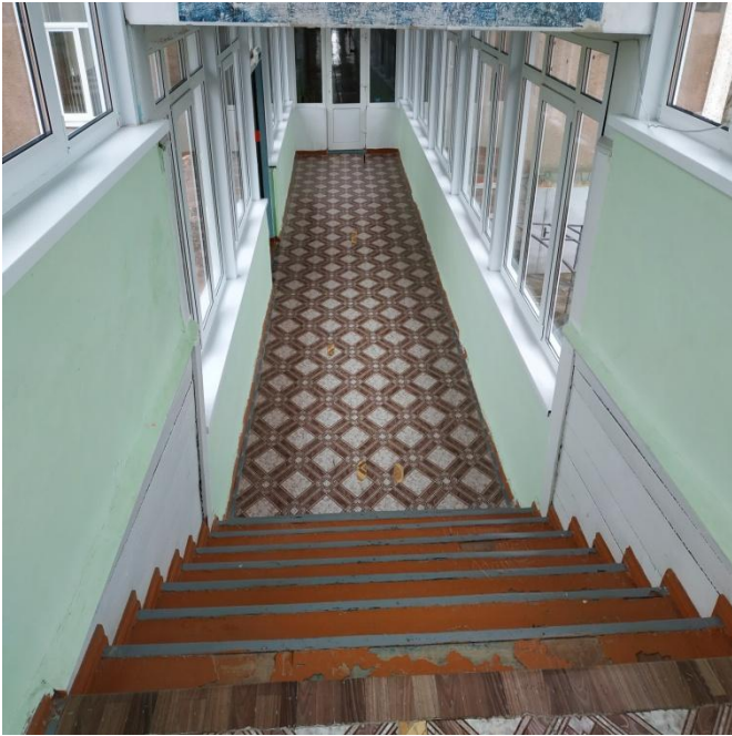
10. Спуск в 1 корпус (переход между корпусами)