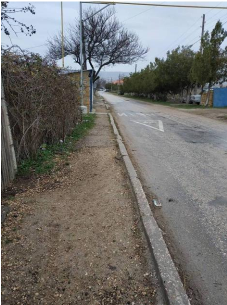
7. Остановка на ул. Комарова (на Белокаменное)