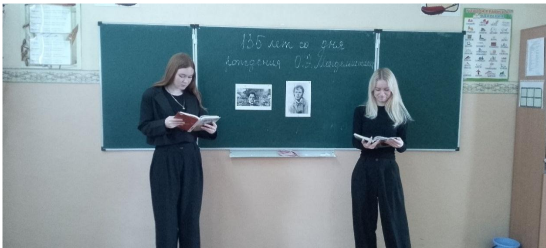
11 класс, информационная минутка