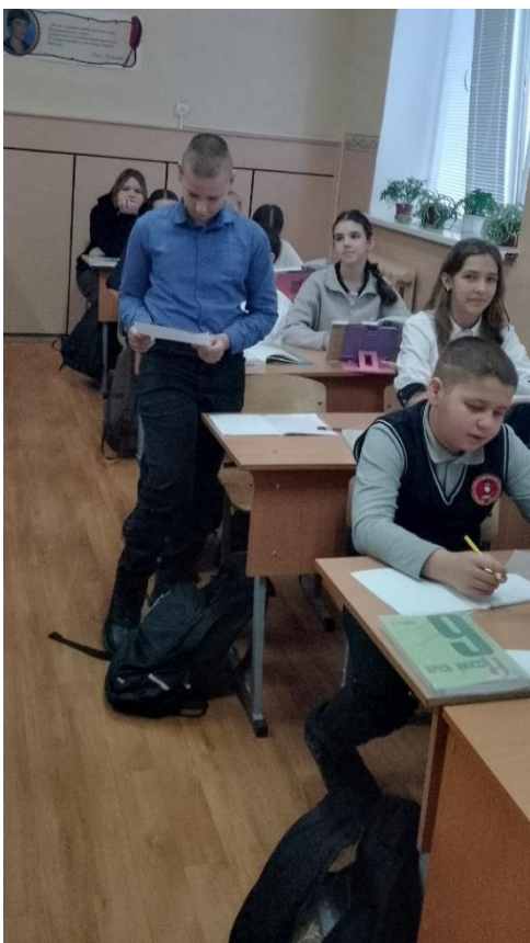
6-А открытый урок