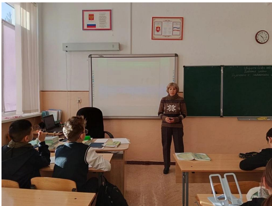
5-А, открытый урок