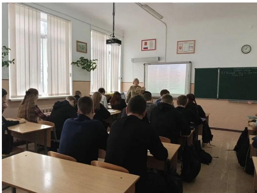
Проблема счастья и смысла жизни в