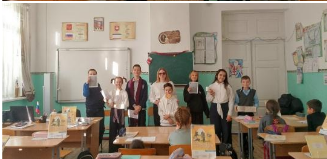
Сценка "Новый год в Простоквашино"