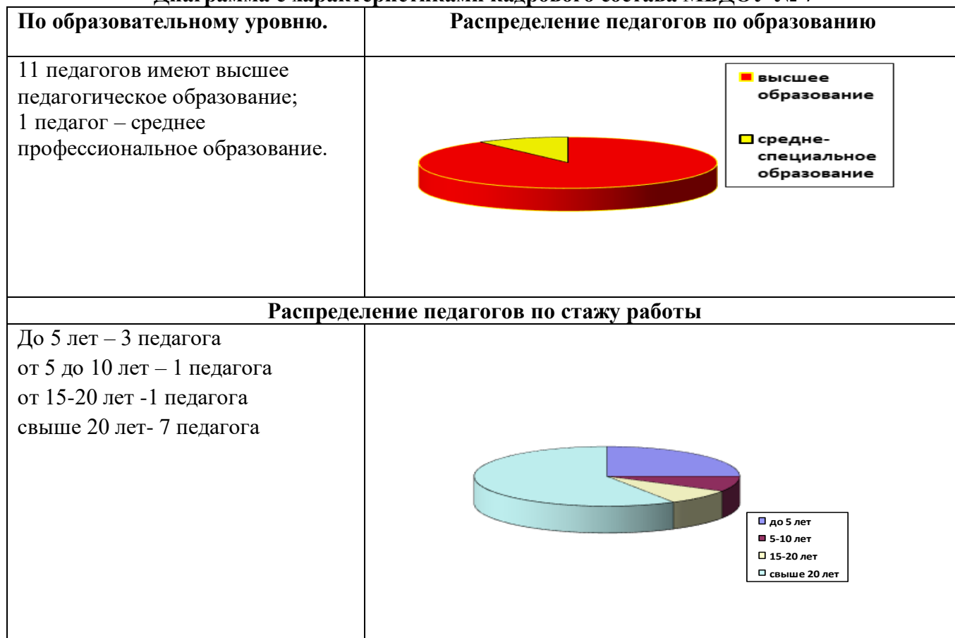
Диаграмма с характеристиками кадрового состава МБДОУ № 7