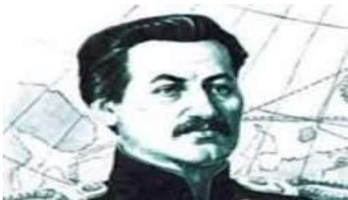
Пахтусов Петр Кузьмич