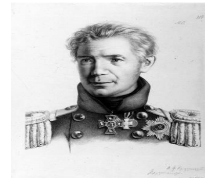
Крузенштерн Иван Федорович

Храбрый – 27 Мужественный – 17 Смелый – 28 Учился в военном училище – 35 Целеустремленный – 13 Сильный духом – 41 Гордый - 11 Трудолюбивый – 14 Умный – 36 Никогда не сдавался -27 Крепкий характер - 22