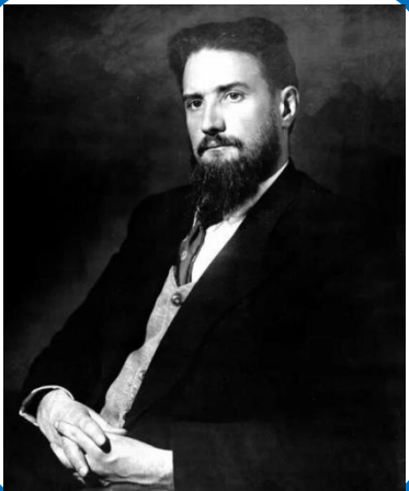
Игорь Васильевич Курчатов, российский физик, организатор и руководитель работ по атомной науке и технике в СССР (1903-1960 г. г)

В любом деле важно определить приоритеты. Иначе второстепенное, хотя и нужное, отнимет все силы и не даст дойти до главного.