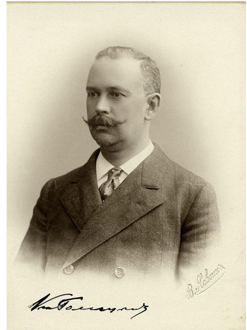
Борис Борисович Голицын

(18 февраля (2 марта) 1862 — 4 (17) мая 1916)