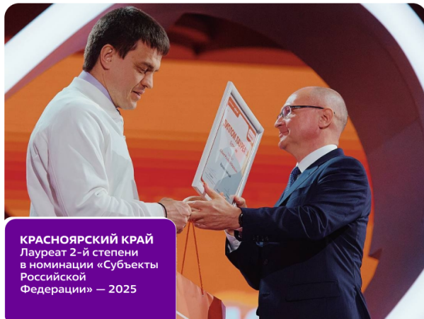
КРАСНОЯРСКИЙ КРАЙ Лауреат 2-й степени в номинации «Субъекты Российской Федерации» — 2025