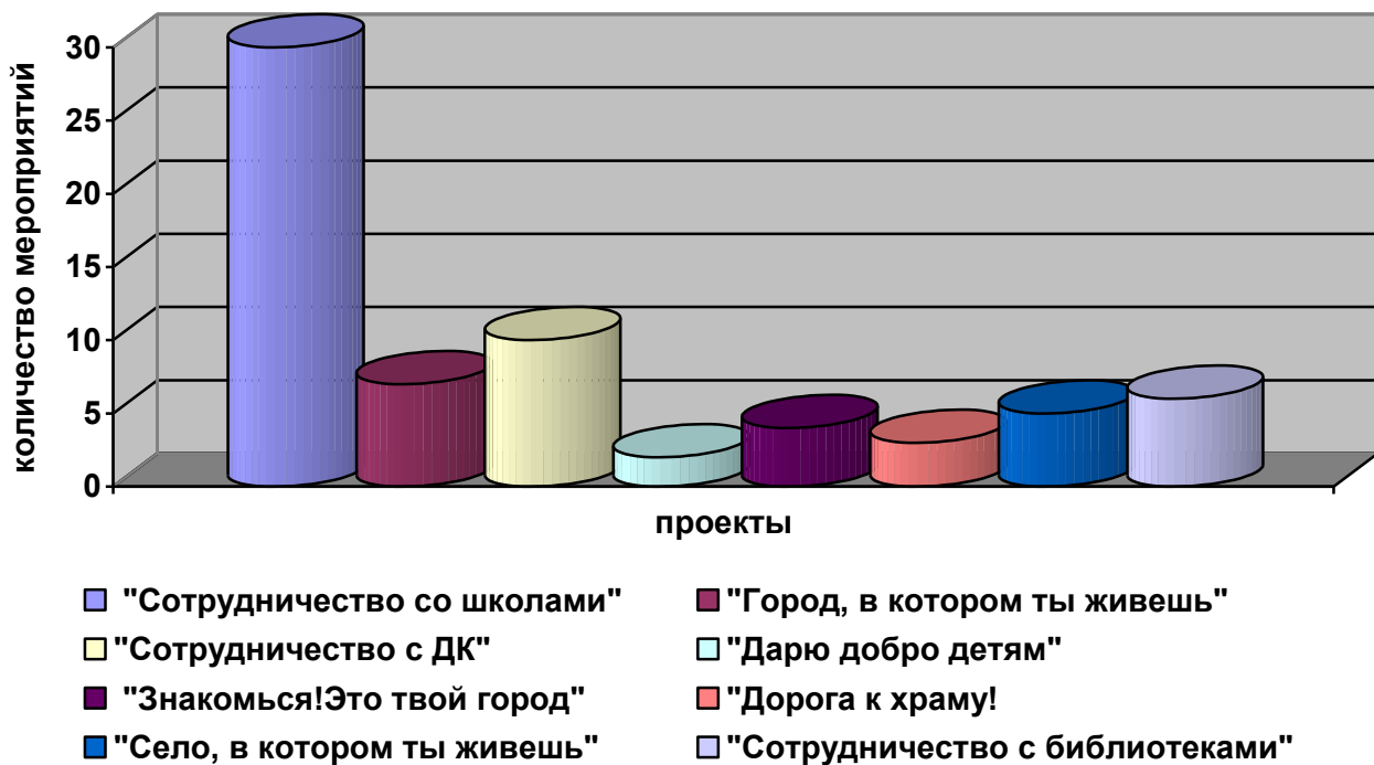
Рис.4. Количество мероприятий по реализации проектов социальных проектов в 2025/2026 учебном году.

По рисунку 8 видно, что максимальное количество мероприятий – 30 реализовано в проекте «Сотрудничество со школами», а минимальное 2 – «Сотрудничество с дошкольными учреждениями «Дарю добро детям».