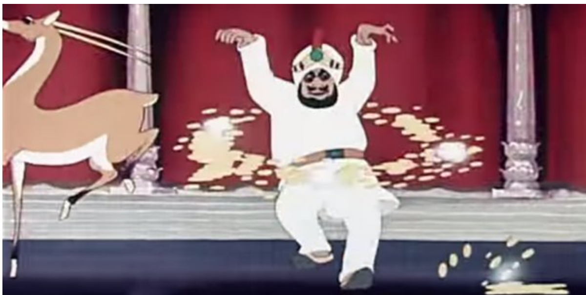
Кадр из мультфильма «Золотая антилопа»