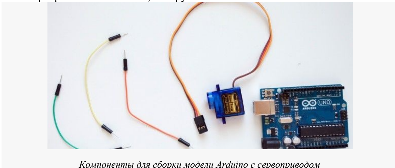
Компоненты для сборки модели Arduino с сервоприводом